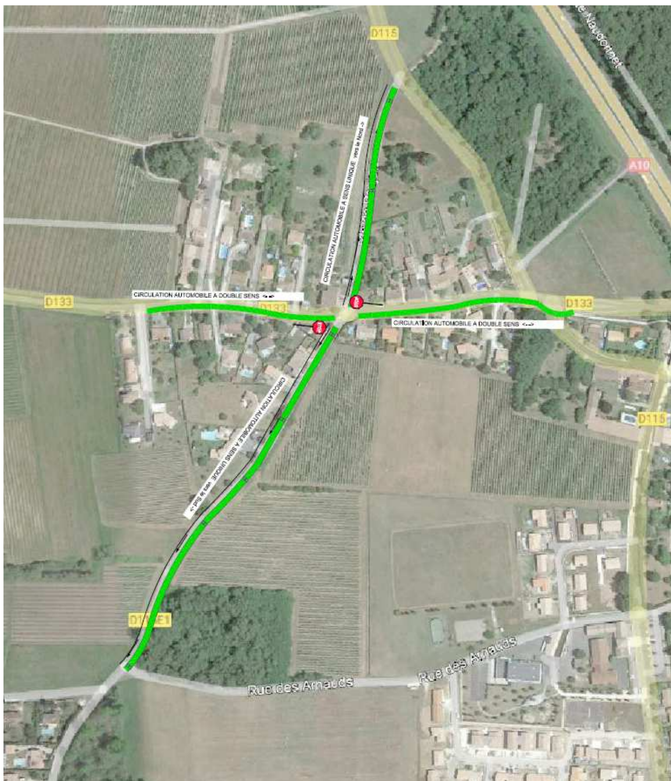
Schéma des sens de circulation

Enfin, compte tenu de la faible emprise du domaine public au droit du carrefour, celui-ci sera réglementé comme zone de rencontre où piétons et cycles sont prioritaires sur les véhicules automobiles et où la vitesse est limitée à 20 km/h